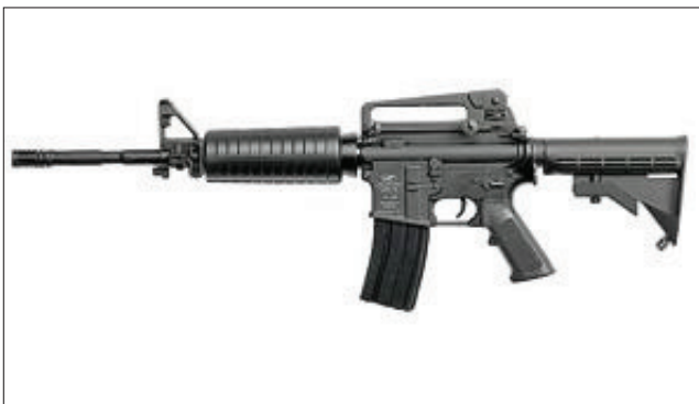
Det var et slik våpen, en tro kopi av automatgeværet Defender 4 Carbine, som utløste politiaksjonen i Arendal denne uken.

At slike våpen importeres og selges lovlig i Norge til alle over 18 år, er en stor frustrasjon for politiet.